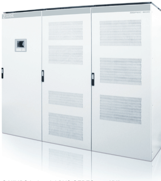
SAI/UPS industrial DVC SEPEC 800 KVA

La gama DVC SEPEC ha sido diseñada para proteger aplicaciones industriales críticas. Su función principal es asegurar la continuidad de suministro de energía en procesos industriales donde la robustez es fundamental. Su diseño le permite trabajar conjuntamente con grupos electrógenos en una configuración que elimina totalmente las interrupciones de red, evitando los pasos por cero, eliminando también los problemas de desclasificación del generador derivados de los consumos armónicos de cargas tipo SAI de doble conversión.